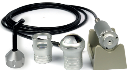
BH9014 MANIPOLO TERAPIA MULTIFUNZIONE