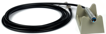
BH5014 MANIPOLO ONDA PIANA