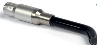
TT5108 60° THERAPIE-TIPP