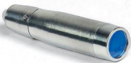
BT5008 FLACHE WELLENKAPPE