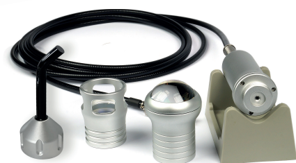
BH9014 MANIPOLO TERAPIA MULTIFUNZIONE