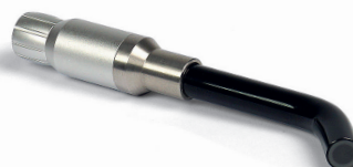
TT5108 PUNTALE TERAPIA 60°