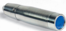
BT5008 PUNTALE ONDA PIANA