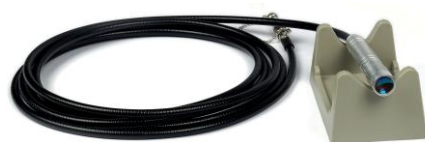
BH5014 PEÇA DE MÃO DE ONDA PLANA