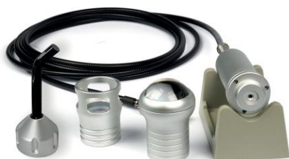
BH9014 PEÇA DE MÃO TERAPIA MULTIFUNÇÕES