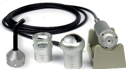
BH9014 MULTIFUNKTIONS- THERAPIE- HANDSTÜCK