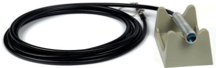
BH5014 PEÇA DE MÃO DE ONDA PLANA