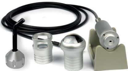
BH9014 PEÇA DE MÃO TERAPIA MULTIFUNÇÕES